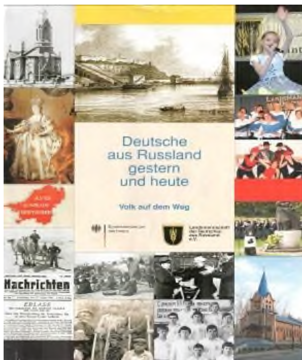
Обложка журнала «Народ в пути»

Обществом организуются молодёжные форумы, на которых принимаются конкретные решения, способствующие разрешению многих молодёжных проблем. Члены общества «Землячество» совершают экскурсии в известные места Германии, например, на Родину Екатерины II в город Цербст, в музеи города Берлина, в концентрационный лагерь «Бухенвальд».