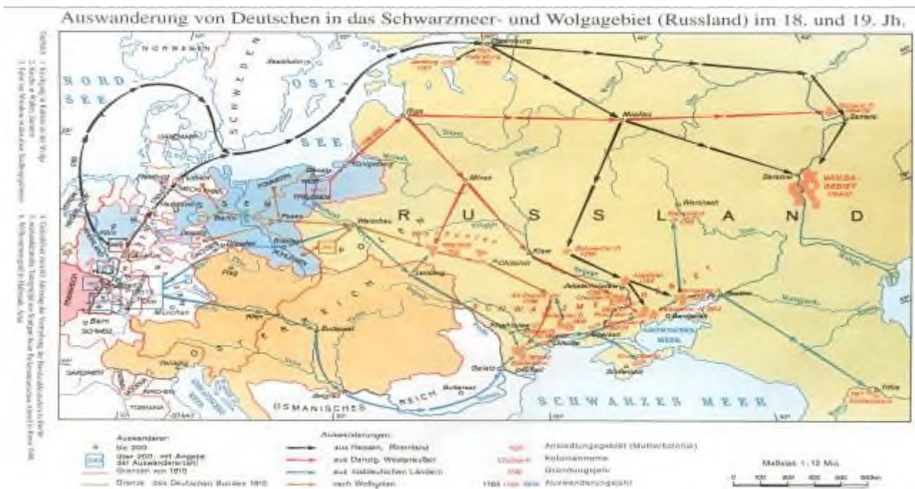
Карта переселения немцев к Черному морю и в Поволжье

Селились они в основном на Волге и у Черноморья, путь переселения пролегал через Северное море, Балтийское море, Петербург к Волге.