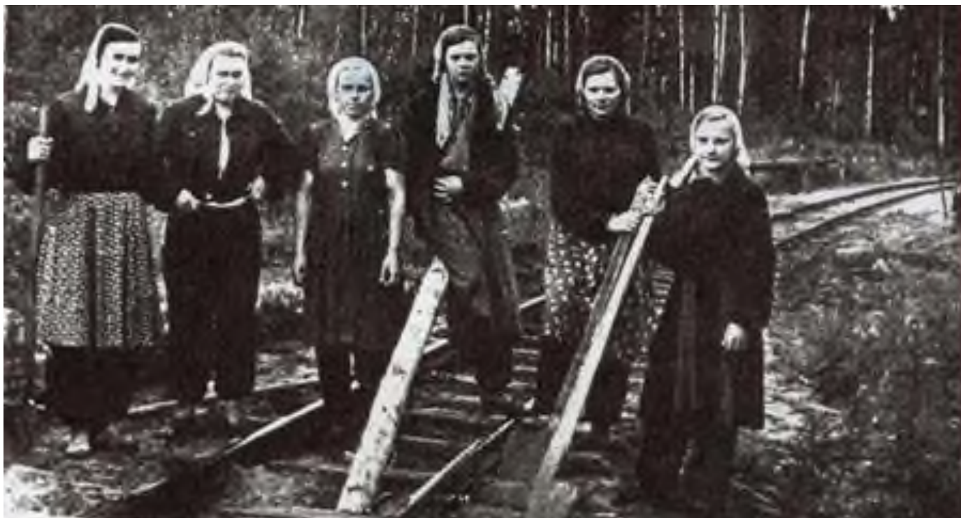
Женщины трудятся на ремонте железной дороги

Не успели российские немцы прийти в себя на местах выселения, как их начали отправлять в трудармию (по официальной терминологии – «рабочие колонны»).